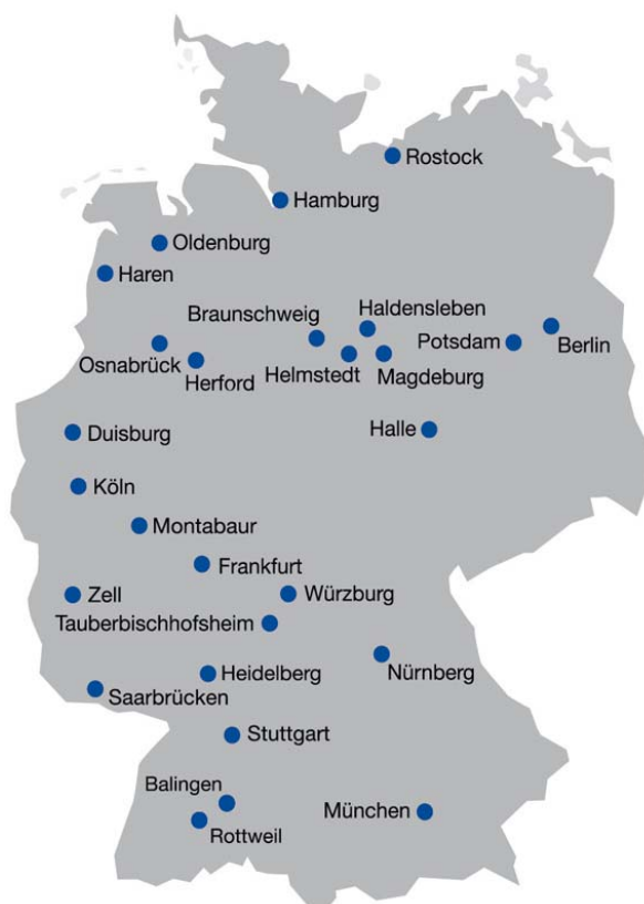
PKF Standorte in Deutschland

Gesellschafter der PKF Deutschland GmbH sind zum Berichtszeitpunkt die nachfolgend aufgeführten Gesellschaften (im vorliegenden Bericht auch „Mitgliedsunternehmen des deutschen PKF Netzwerks“ genannt):