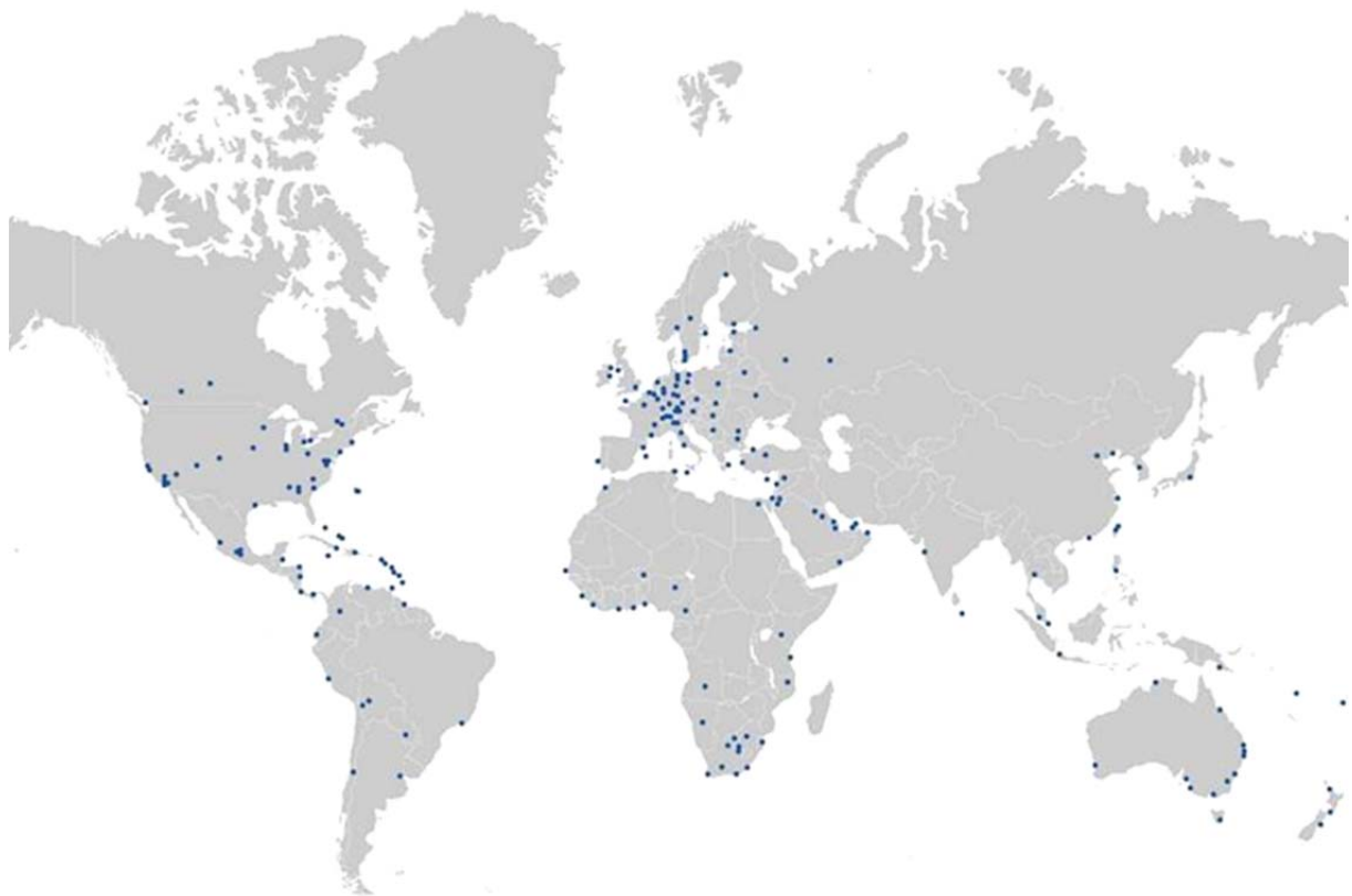
PKF Standorte weltweit

PKF International Ltd. unterscheidet zwischen Mitgliedsunternehmen („Member Firms“) und angeschlossenen Unternehmen („Correspondent Firms“). Angeschlossene Unternehmen haben keines der Rechte, Privilegien oder Pflichten eines Mitgliedsunternehmens und werden durch das Globally Directed Quality Assurance Program nicht erfasst. Die aktuelle Liste von Mitgliedsunternehmen und angeschlossenen Unternehmen findet sich auf der Webseite www.pkf.com .